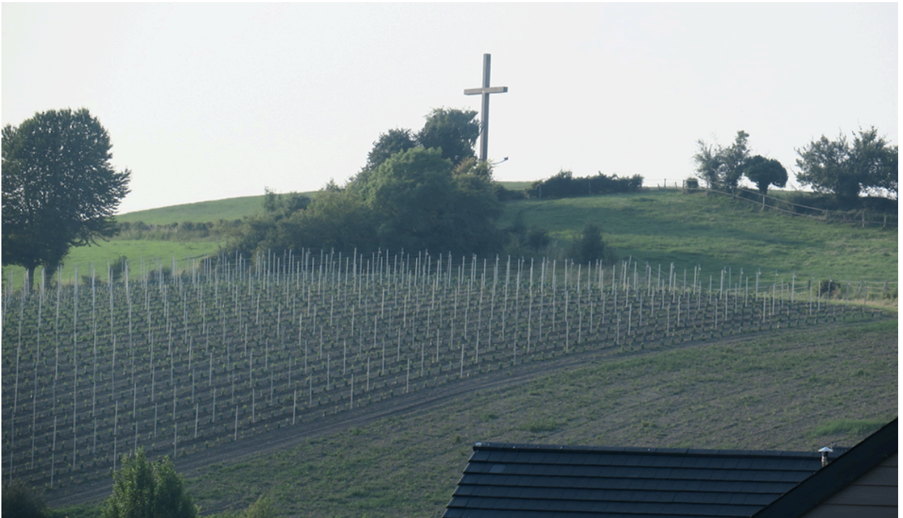
(nouvelle parcelle à côté de la Croix de Hombourg)